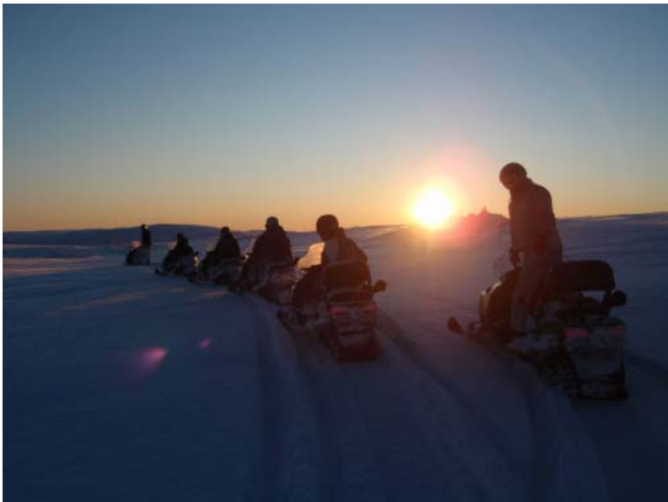
Från Vinterkursen 2009.